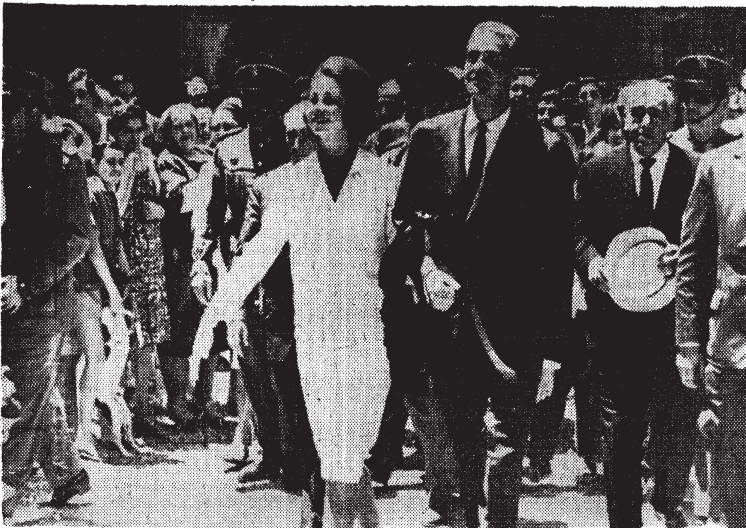
Un momento del cariñoso homenaje popular que los granadinos rindieron a los principes cuando éstos salían de la Capilla de los Reyes Católicos.